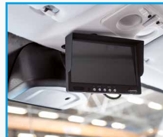
Monitor für Rückfahrkamera im Fahrerhaus