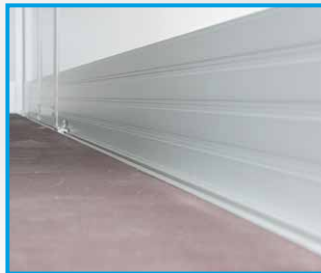
Scheuerleiste 150 / 300 mm