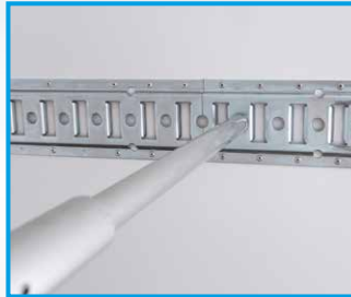
Integrierte oder aufgesetzte Zurrleisten mit Sperrstange(n)