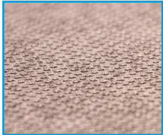
Holzboden 18/21/24/27 mm