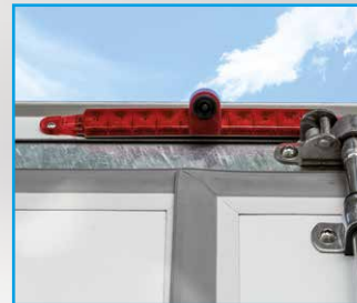
3. Bremsleuchte mit integrierter Rückfahrkamera