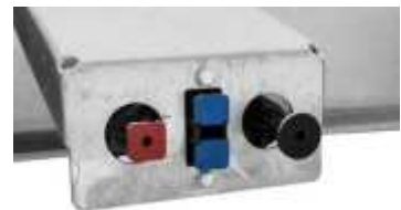
Bremssystem mit Federspeicher-Feststellbremse